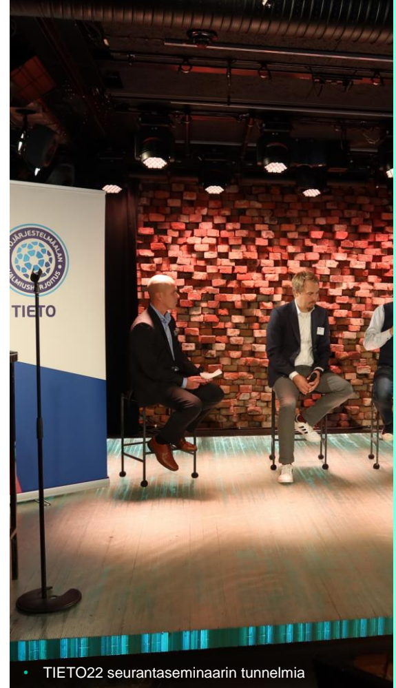
• TIETO22 seurantaseminaarin tunnelmia